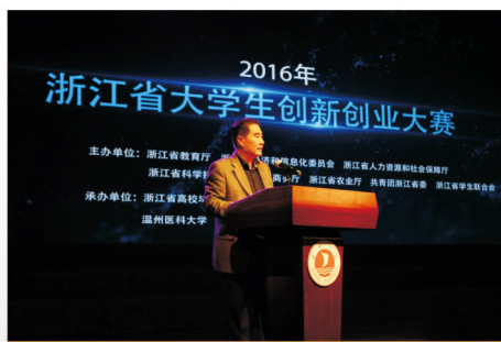
2016年浙江省大学生创新创业大赛启动仪式

我校自2010年以来，陆续成立了大学生创业实践园、创业学院。创业学院会定期开展课程培训，培养学生的创业精神，提升学生的创业能力，帮助学生熟悉创业实务。有意向创业的同学向学校有关部门提交申请，学校会成立专家组在其中遴选优秀企业入驻大学生创业实践园，入住期为两年。在此期间，入驻企业能享受到各种政策和费用上的优惠。除此之外，校团委还定期开办创业集市，不但满足了学生小商品交易的需求，更是为其提供了一个创业的先行舞台。